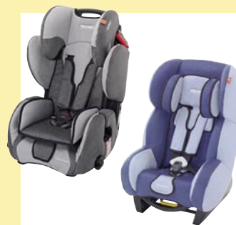
weitere Reha-Modelle ab 2009 erhältlich (RECARO Young Sport und RECARO Young Expert)