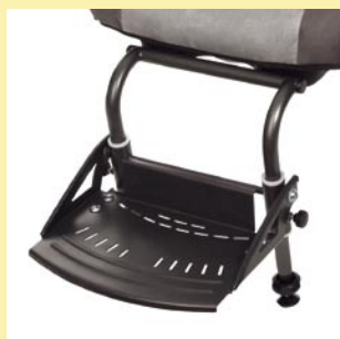
individuell anpassbares Reha-Zubehör, z.B. abklappbare Fußstütze