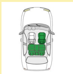
Platzierung im Fahrzeug: Rücksitzbank (3-Punkt-Gurt), Beifahrersitz